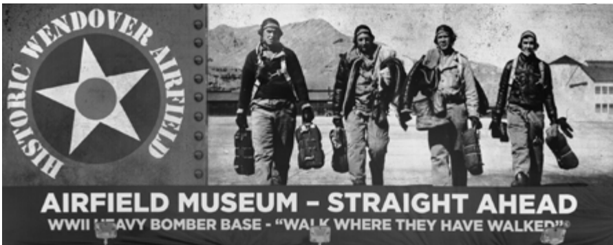
Abb. 1: Wendover Airfield

Geschehen eingebunden wird. Derart zielen diese Praktiken auf die notwendige Überbrückung einer zeitlichen Distanz, jedoch unter vollkommener Auslassung der Frage nach der Zugänglichkeit von historischer Wirklichkeit: Es wird angenommen, dass die Überlieferungen (die Dokumente) historisch korrekt, also wahr sind, dass sie jedoch schwer ›verständlich‹, unzugänglich, zu hermetisch sind – daher müssen sie verkörpert werden, um so einen tieferen, direkteren Zugang zu einer historischen Wirklichkeit zu ermöglichen, die als solche nicht in Frage steht.