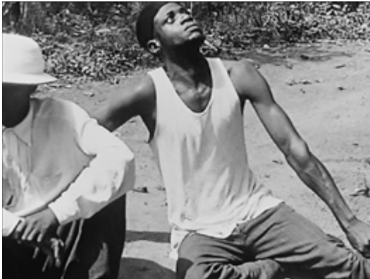
Abb. 2: Filmstill aus Jean Rouch, LES MAÎTRES FOUS

pernden Prinzip folgt. Wie u. a. Michael Taussig in Erinnerung ruft, entwickelte sich die Hauka-Bewegung bereits Mitte der 1920er Jahre aus der Bevölkerungsgruppe der Songhay, die als Arbeitsmigranten aus dem Niger nach Accra in Ghana gekommen waren. Die Hauka-Rituale waren Besessenheitsrituale, bei denen die Teilnehmer von den Geistern der weißen Kolonialisten besessen wurden: »They became possessed by the spirit of the French major who had first taken offensive against them, who imprisoned those who began the movement, who slapped them around until they said there was no such thing as Hauka. Thus deified as »the