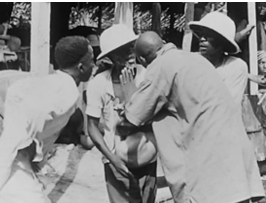
Abb. 3: ›Roundtable Konferenz‹; Filmstill aus Jean Rouch, LES MAÎTRES FOUS

führt zu einer körperlichen Nachstellung der Auf- und Verteilung von Rollen und Aktivitäten im herrschenden Kolonialsystem. In diesem Sinne könnte man sagen, dass mit diesen zwei Spielarten von Verkörperung zugleich zwei Begriffe von Nachahmung als Verkörperung sowie deren normative Folgen miteinander in Beziehung treten: So verbindet sich eine protokollarische Nachahmung, die in der mimetischen Verkörperung der Kolonialherren entsteht, mit einer exzessiv-mimetischen Nachahmung durch die Einverleibung des Geistes dieser Kolonialherren: Identifizierende ( conscious ) Verkörperung und zerstörerische ( bodily ) Einverleibung stellen nicht nur zwei