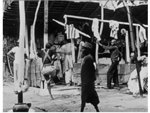
Abb. 5: »Le protocole est le même«, Filmstills aus Jean Rouch, LES MAÎTRES FOUS

Körper durch die weißen Kolonistenkörper zielt, noch auf die Abschüttelung dieser Unterwerfung durch die Kolonialmacht, sondern zugleich auch deren körpertechnische Disziplinierung vorrechnet. Oder, wie der Film es selbst formuliert: »l'ordre est différent, le protocole est bien le même« – das (mimetische) Protokoll, das alle Körper der Identifizierung unterwirft, aber auch allen Körpern das hypermimetische Moment der exzessiven Durchschlagung – der Des-Identifizierung – von einem solchen Protokoll eröffnet.